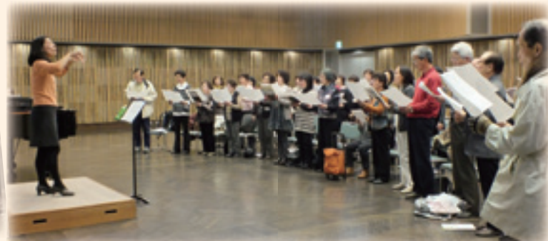
③最後は、みんなで気持ち良く合唱♪

久しぶりに大きな声を出せて気持ちよかったです!疲れたけど、歌い終わった今は10歳ぐらい若返った気分です(笑) 周りの皆さんの声に負けないよう無我夢中で歌ってたら、恥ずかしさは吹き飛んでましたね。合唱の難しさも感じたけれど、大勢で声を合わせて歌う気持ちよさも体感できました!興味をもったらどんなことでも、実際にやってみるのって大事ですね。