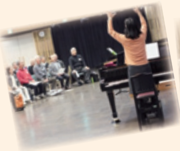
①先生が発声のコツを伝授♪