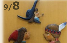
9/8 ウッドアートの体験