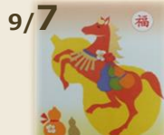
9/7 和紙ちぎり絵の体験