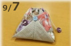
9/7 簡単きんちゃく作り