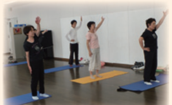
③最初より、身体が動きやすくなりました♪