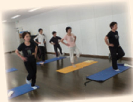
①まずは、姿勢の歪みのチェックから