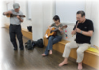
本番目前、バンビオで練習!息もぴったり♪