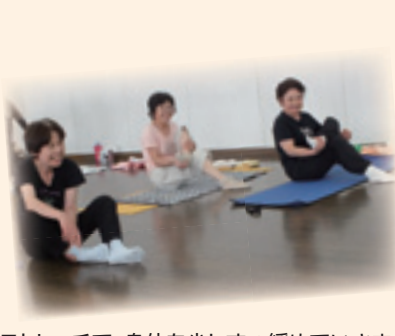
②ストレッチで、身体を少しずつ緩めていきます